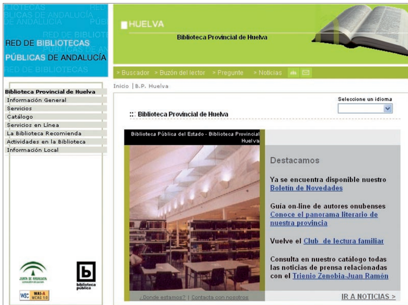
La Biblioteca Provincial de Huelva en el Portal de Bibliotecas

el profesional como para el usuario final.